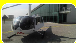
Foto: Robinson R44

Optionen: Andere Zimmerkategorien sind je nach Verfügbarkeit zum normalen Listenpreis buchbar.