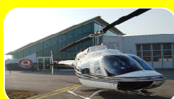
Foto: Bell B206